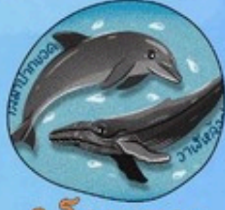
3. โลมาและวาฬทุกชนิด