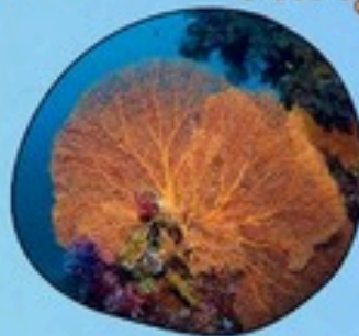
6. กัลปังหาทุกชนิด