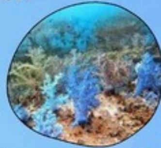
7. ปะการังไฟ