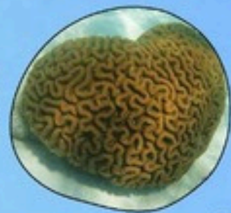
11. ปะการังแข็ง