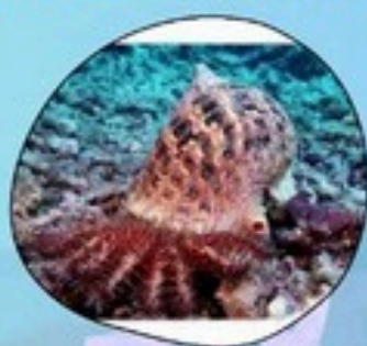
13. หอยสังข์แตร

ประกาศกระทรวงเกษตรและสหกรณ์ เรื่อง กำหนดชนิดสัตว์น้ำที่เลี้ยงลูก ด้วยนม สัตว์น้ำที่หายากหรือใกล้ สูญพันธุ์ ที่ห้ามจับ หรือนำขึ้นเรือ ประมง พ.ศ. 2559 อาศัยอำนาจตาม ม.66 พรก.การประมง พ.ศ.2558