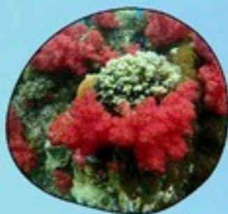
9. ปะการังอ่อน