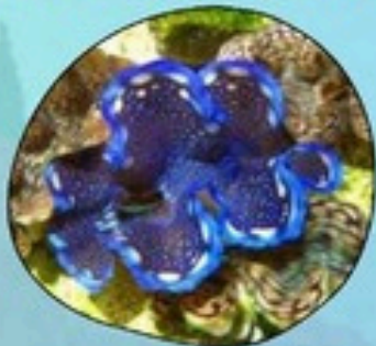
12. หอยมือเสือ