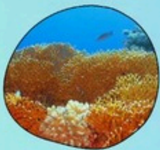
8. ปะการังไฟ