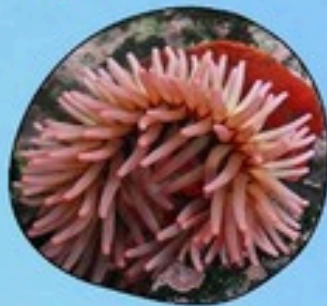
10. ดอกไม้ทะเล