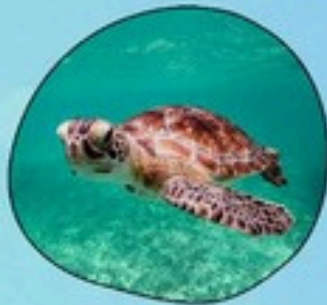
1. เต่าทะเล