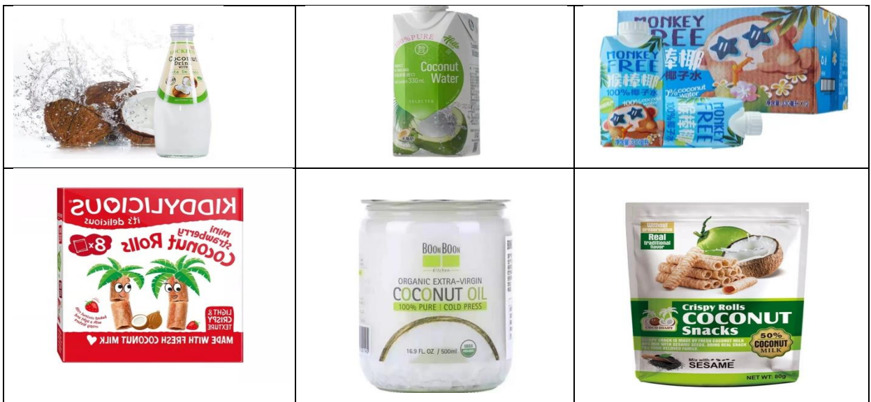
*โปรโมชั่นลดราคา

*ผลิตภัณฑ์เหล่านี้มีการเขียนบนฉลากว่านำเข้าจากประเทศไทย