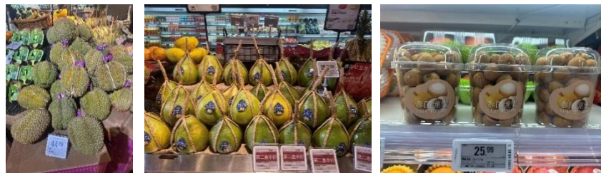
ภาพผลไม้ไทย ที่จำหน่ายในซูเปอร์มาร์เก็ต Ole กรุงปักกิ่ง

ในเดือนมีนาคม 2569 ตลาดซินฟาตี้ กรุงปักกิ่ง มีการประกาศราคาผลไม้ ดังนี้ มังคุดไทย ราคาอยู่ที่ 56 - 62 หยวน/กิโลกรัม (280 - 310 บาท/กิโลกรัม) ส่วนมังคุดอินโดนีเซีย ไม่มีการประกาศราคาขาย ทุเรียนหมอนทองเวียดนาม ราคาคงที่อยู่ที่ 61 หยวน/กิโลกรัม (305 บาท/กิโลกรัม) ราคาทุเรียนก้านยาวเวียดนาม (Ri6) ราคาคงที่อยู่ที่ 43 หยวน/กิโลกรัม (215 บาท/กิโลกรัม) ในช่วงปลายเดือนมีทุเรียนไทยพันธุ์กระดุมเข้ามา ราคาอยู่ที่ 50 หยวน/กิโลกรัม (250 บาท/กิโลกรัม) ลำไยไทยมีราคาคงที่ อยู่ที่ 19.50 หยวน/กิโลกรัม (97.50 บาท/กิโลกรัม) มะพร้าวไทย ราคาอยู่ที่ 8.65 หยวน/ลูก (43.25 บาท/ลูก) ส้มโอ ราคาคงที่อยู่ที่ 21 หยวน/กิโลกรัม (105 บาท/กิโลกรัม) และน้อยหน่าไทยราคาอยู่ที่ 34-40 หยวน/กิโลกรัม (170 - 200บาท/กิโลกรัม)