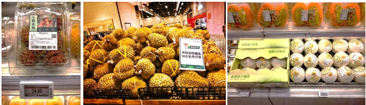
ภาพผลไม้ไทย ที่จำหน่ายในซูเปอร์มาร์เก็ต 7 Fresh กรุงปักกิ่ง

ในเดือนเมษายน 2569 ตลาดซินฟาตี้ กรุงปักกิ่ง มีการประกาศราคาผลไม้ ดังนี้ มังคุดไทย ราคาอยู่ที่ 51 - 56 หยวน/กิโลกรัม (255 - 280 บาท/กิโลกรัม) ส่วนมังคุดอินโดนีเซีย ไม่มีการประกาศราคาขาย ทุเรียนหมอนทองเวียดนาม ราคาอยู่ที่ 38 - 73 หยวน/กิโลกรัม (190 - 365 บาท/กิโลกรัม) ราคาทุเรียนก้านยาวเวียดนาม (Ri6) ราคาอยู่ที่ 33 - 43 หยวน/กิโลกรัม (165 - 215 บาท/กิโลกรัม) ในช่วงต้นเดือนมีทุเรียนไทย พันธุ์กระดุมเข้ามาวางจำหน่าย ราคาอยู่ที่ 50 หยวน/กิโลกรัม (250 บาท/กิโลกรัม) และทุเรียนหมอนทองไทย เริ่มมีการประกาศราคาในช่วงกลางถึงปลายเดือน ราคาอยู่ที่ 48 - 54 หยวน/กิโลกรัม (240 - 270 บาท/กิโลกรัม) ลำไยไทยมีราคาคงที่ อยู่ที่ 19.50 หยวน/กิโลกรัม (97.50 บาท/กิโลกรัม) มะพร้าวไทย ราคาอยู่ที่ 7.20 - 8.65 หยวน/ลูก (36 - 43.25 บาท/ลูก) ส้มโอ ราคาคงที่ อยู่ที่ 21 หยวน/กิโลกรัม (105 บาท/กิโลกรัม) ช่วงปลายเดือนมีน้อยหน่าไทย ราคาอยู่ที่ 34 หยวน/กิโลกรัม (170 บาท/กิโลกรัม) และขนุนเวียดนาม ราคาอยู่ที่ 12 หยวน/กิโลกรัม (60 บาท/กิโลกรัม)