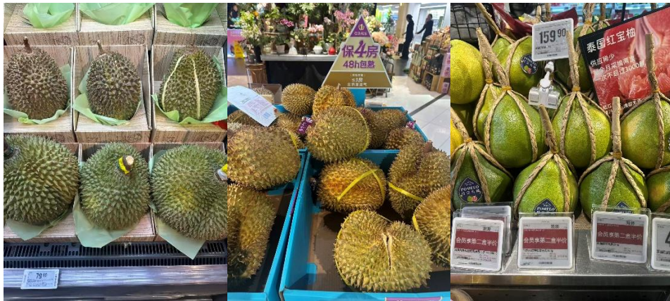
ภาพผลไม้ที่จำหน่ายในซูเปอร์มาร์เก็ต Ole กรุงปักกิ่ง

เดือนนี้มีลำไยสีทองของไทยวางจำหน่ายที่ Hema และ Meituan ซูเปอร์มาร์เก็ต ราคาอยู่ที่ 25.90 หยวน/500 กรัม (129.50 บาท) และ 16.95 - 25.40 หยวน/500 กรัม (84.75 - 127 บาท) ตามลำดับ