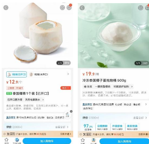
ภาพมะพร้าวไทยที่จำหน่ายในซูเปอร์มาร์เก็ต Hema ณ กรุงเทพฯ

มะพร้าวของไทยที่วางจำหน่ายในซูเปอร์มาร์เก็ตในกรุงเทพฯ ส่วนใหญ่จะขายแยกเป็นลูก มีทั้งแบบมะพร้าวสดแบบผ่าพร้อมเปิด และมะพร้าวสดปกติ โดยแบบผ่าพร้อมเปิดมีราคาใกล้เคียงกับมะพร้าวสดปกติ สำหรับราคาขายในร้าน Hema, 7Fresh และ Meituan 9.90 - 12.90 หยวน/ลูก (49.50 - 64.50 บาท) 9.80 หยวน/ลูก (49 บาท) และ 9.30 - 11.90 หยวน/ลูก (46.50 - 59.50 บาท) ในเดือนนี้ยังคงมีมะพร้าวไทยปอกเปลือกวางจำหน่ายตามซูเปอร์มาร์เก็ตในกรุงเทพฯ Hema, 7Fresh และ Meituan 19.90 หยวน/500 กรัม (99.50 บาท) และ 15.80 - 19.80 หยวน/ลูก (79 - 99 บาท) และ 14.25 - 17.90 หยวน/ลูก (71.25 - 89.50 บาท) ตามลำดับ