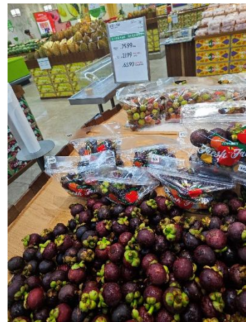
ภาพผลไม้ไทยที่จำหน่ายใน Guo Shu Hao (GSH) ซูเปอร์มาร์เก็ต กรุงเทพมหานคร