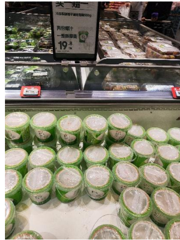
ภาพผลไม้ไทยที่จำหน่ายใน 7Fresh ซูเปอร์มาร์เก็ต กรุงเทพมหานคร