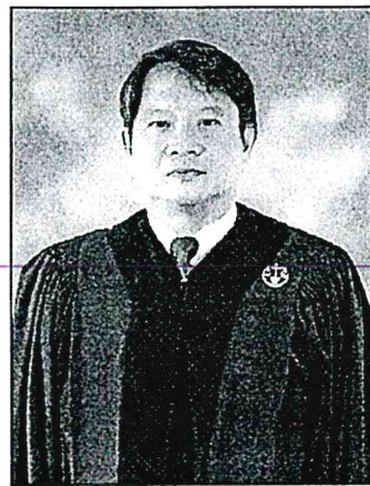
๒. นายตระหง่าน เกียรติศิริโรจน์ อธิบดีศาลปกครองชั้นต้น