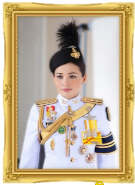
ทรงพระเจริญ