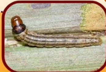
หนอนหัวดำ