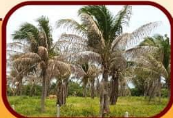
ลักษณะการเข้าทำลาย

สอบถามรายละเอียดเพิ่มเติม สำนักงานเกษตรจังหวัด และสำนักงานเกษตรอำเภอใกล้บ้าน