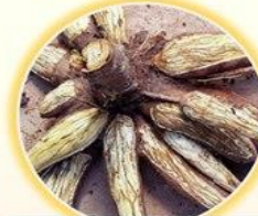
เชื้อลุกลามลงหัวใต้เปลือกมีเส้นสีดำ