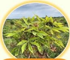
ยอดมันแตกพุ่มฝอยมากกว่าปกติ