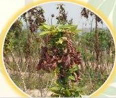
มีอาการยอดพุ่มใบเหลือง ยืนต้นตาย