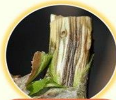
ใต้เปลือกมีเส้นสีดำ