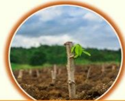
ใช้ก่อนพันธุ์ที่เป็นโรคมานปลูก