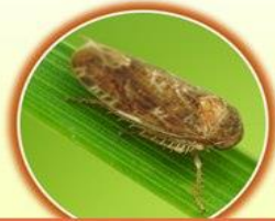
เพลี้ยจักจั่น (พาหะนำโรค)