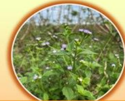
ต้นสาบม่วง (พืชอาศัยของโรค)