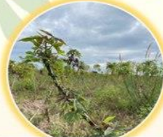
ต้นแคระแกร็นแตกยอดเป็นพุ่มฝอย