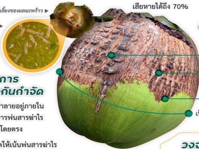
ตัวเต็มวัยของโรสี้ขามะพร้าว ▶ เมื่อมองผ่านกล้องขยาย