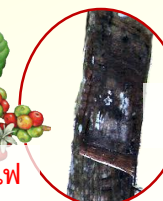
โรคน้ำกรีดยาง