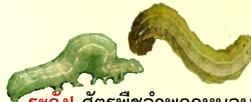
ระวัง! ศัตรูพืชจำพวกหนอน

- อากาศเย็นในตอนเช้า อุณหภูมิจะลดลง 1-3 °ซ. ช่วงวันที่ 7-12 พ.ย. และมีฝนบางแห่ง