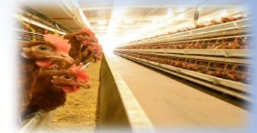
สัตว์เลี้ยง โดยเฉพาะสัตว์ปีก