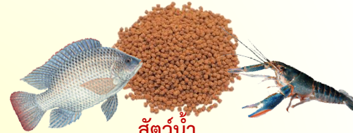
สัตว์น้ำ