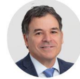
Frank Yiannas Food Safety Culture Expert