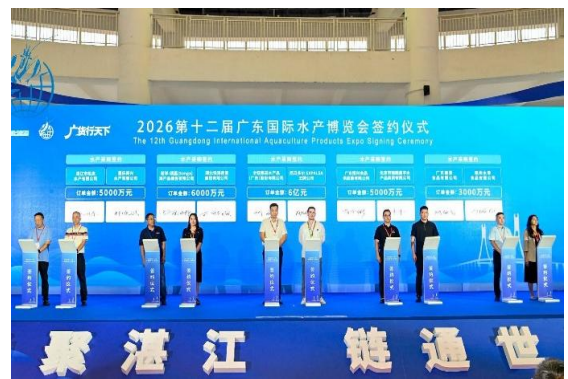
พิธีลงนามคำสั่งซื้อสินค้าประมง จำนวน 10 บริษัท