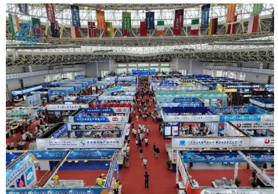
บรรยากาศภายในงาน