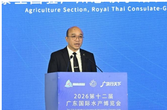
กงสุล (ฝ่ายเกษตร) ขึ้นกล่าวในงาน

จัดโดยรัฐบาลเมืองจ้านเจียง มณฑลกว่างต้ง ร่วมกับ สมาคมประมงภาคตะวันตกมณฑลกว่างต้ง (Guangdong Yuexi Fisheries Association) และหอการค้าการเพาะเลี้ยงสัตว์น้ำของจีน (All-China Aquaculture Chamber of Commerce) โดยมีขอบเขตการจัดแสดงภายในงาน ได้แก่ 1. สินค้าสัตว์น้ำแช่แข็งและสำเร็จรูป 2. เครื่องมืออุปกรณ์และเทคโนโลยีการเพาะเลี้ยงสัตว์น้ำ 3. ยาและหัวอาหารสัตว์น้ำ 4. เทคโนโลยีและเครื่องมือประมง 5. เครื่องจักรผลิตหัวอาหารสัตว์น้ำ 6. การแปรรูป การบรรจุ และการขนส่ง โดยมีพื้นที่จัดงาน 30,000 ตารางเมตร มีผู้ประกอบการกว่า 400 รายร่วมออกคูหา และมีผู้ซื้อกว่า 4,000 รายเข้าร่วมงาน โดยมาจาก 20 ประเทศ ได้แก่ จีน ไทย เอกวาดอร์ เวียดนาม มาเลเซีย อินโดนีเซีย และอินเดีย เป็นต้น โดยสินค้าหลักภายในงานจะเน้นไปที่กุ้ง ทั้งการจำหน่ายลูกกุ้ง หัวอาหารกุ้ง กุ้งต้มสุกแช่แข็ง และกุ้งแช่แข็ง เป็นต้น ในงานนี้ได้มีการลงนามคำสั่งซื้อสินค้าประมงรวม 10 บริษัท โดยเฉพาะบริษัท Expalsa ของเอกวาดอร์ กับ บริษัท All-China Federation of Aquatic Products (Guangdong) จำกัด ที่มียอดสั่งซื้อกว่า 1,000 ล้านบาทด้วย