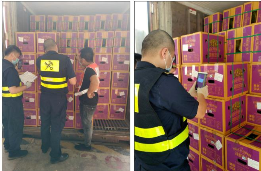
เจ้าหน้าที่ศุลกากรโหย่วอี้กวนกำลังปฏิบัติงานตรวจสอบกักกันผลไม้ไทย

รถคอนเทนเนอร์ทุเรียนไทยที่ติดฉลากตรวจสอบย้อนกลับของบริษัท CCIC ได้จอดรอที่ลานตรวจของด่านโหย่วอี้กวน เจ้าหน้าที่ศุลกากรได้สแกนคิวอาร์โค้ด (QR Code) ตรวจเช็คข้อมูลที่เกี่ยวข้องทั้งแหล่งผลิต สวนผลไม้ โรงคัดบรรจุ ผู้ส่งออก และกระบวนการจัดส่ง หลังจากกักกักปฏิบัติงานตรวจสอบกักกันแล้ว จึงได้ตรวจปล่อยสินค้า