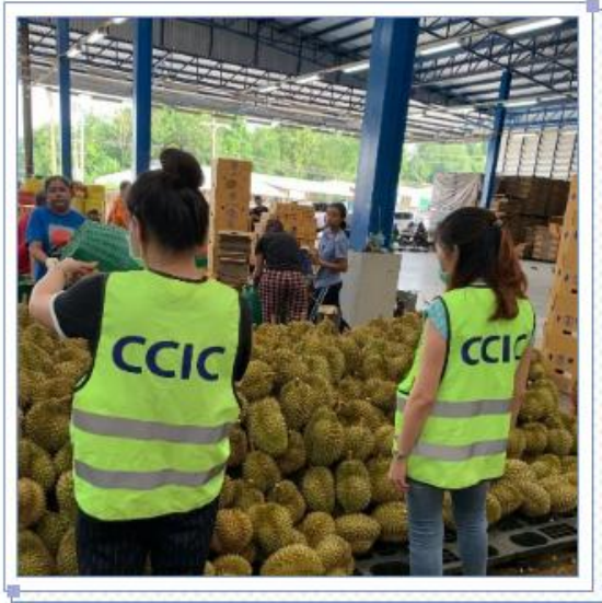
พนักงานของบริษัท ซี ซี ไอ ซี (ประเทศไทย) จำกัด กำลังตรวจสอบยืนยันสถานที่โรงคัดบรรจุทุเรียนไทย