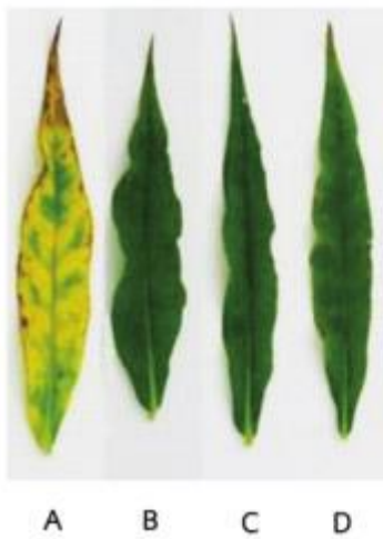
รูปที่ 1 การเหลืองของใบฟลอกซ์ ( Phlox paniculata L.) ที่พัลซิ่งด้วยน้ำประปา (A) TDZ ความเข้มข้น 10 \mu\text{M} + phosphate citrate buffer pH 4.0 (B) pH 6.0 (C) and pH 7.0 (D) เป็นเวลา 24 ชั่วโมง ณ ห้องควบคุมอุณหภูมิ (20°C, ความชื้นสัมพัทธ์ 70-80% ให้แสงจากหลอดฟลูออเรสเซนต์ เป็นเวลา 12 ชั่วโมงต่อวัน) แล้วจึงเก็บรักษาในสภาพมืดที่อุณหภูมิ 2 องศาเซลเซียส เป็นเวลา 8 วัน เพื่อเลียนแบบสภาวะการขนส่งทางเรือ หลังจากนั้น ย้ายมาปักชำใน TOG-6 ณ ห้องควบคุมอุณหภูมิอีกครั้งตลอด

สาร และวิธีการที่ได้รับสารนั้น อย่างไรก็ตาม ได้มีการศึกษาประสิทธิภาพของสารกลุ่มนี้อย่างต่อเนื่อง ในการชะลอการเสื่อมสภาพ ของพืช