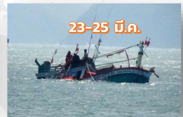
เพิ่มความระมัดระวัง