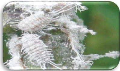
ศัตรูพืชจำพวกเพลี้ย

ความชื้นสัมพัทธ์ 70-80% : ความยาวนานแสงแดด 4-6 ชม.