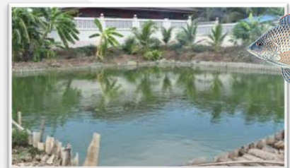
สัตว์น้ำ ดูแลปริมาณน้ำ ให้เหมาะสมกับจำนวนสัตว์น้ำ

ความชื้นสัมพัทธ์ 65-75% : ความยาวนานแสงแดด 5-7 ชม.