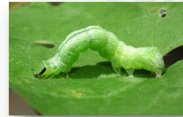
ศัตรูพืชจำพวกหนอน

ความชื้นสัมพัทธ์ 75-85% : ความยาวนานแสงแดด 4-6 ชม.