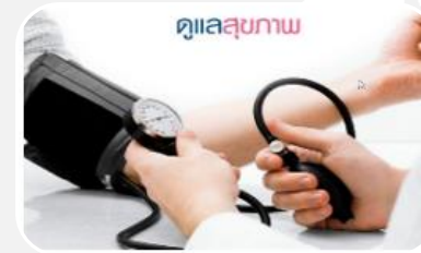
อากาศเปลี่ยนแปลง ดูแลสุขภาพ

ความชื้นสัมพัทธ์ 60-70% : ความยาวนานแสงแดด 4-7 ชม.