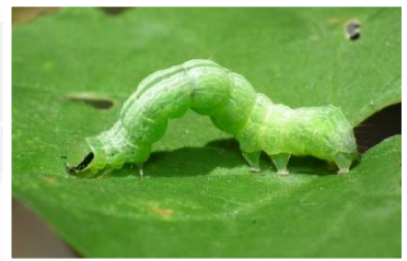
ศัตรูพืชจำพวกหนอน

ความชื้นสัมพัทธ์ 65-75% : ความยาวนานแสงแดด 4-7 ชม.