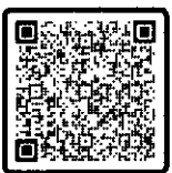
รายละเอียดการสมัคร