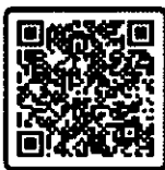
แบบฝึกอบรม ทั้ง 12 แผนก