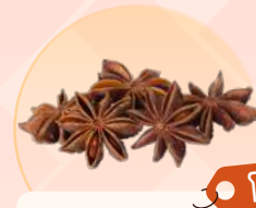
โป๊ยกิ่ง

ขับลม บรรเทาอาการปวดท้อง ขับเสมหะ แก้ไอ ลดกลิ่นปาก