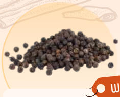
พริกไทยดำ

ขับลม กระตุ้นการย่อยอาหาร ขับเหวื้อ บรรเทาอาการหวัด