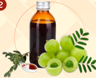
กลุ่มผลิตภัณฑ์สมุนไพรเพื่อรักษาอาการไอหวัด และแพ้ากาศ (Herbal/Traditional Cough, Cold and Allergy (Hay Fever) Remedies)