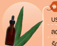
น้ำبنญคาลิปตัส

ลดอาการปวดเมื่อย มีฤทธิ์นำเชื้อ ใช้เป็นยาขับลม