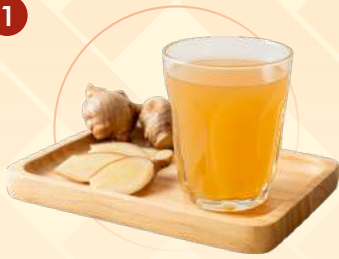
กลุ่มผลิตภัณฑ์เสริมอาหารชนิดพร้อมดื่ม (Herbal/Traditional Tonics)