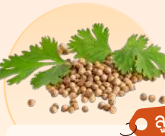
ลูกผักชี

ขับลม กระตุ้นการย่อยอาหาร ขับเหวื้อ บรรเทาอาการหวัด