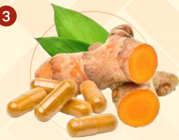
กลุ่มผลิตภัณฑ์เสริมอาหาร (Herbal/Traditional Dietary Supplements)

ที่มา : กลุ่มส่งเสริมพืชสมุนไพรและเครื่องเทศ กรมส่งเสริมการเกษตร, 2568