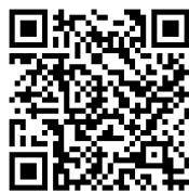
รายงานการประชุม ครั้งที่ ๑/๒๕๖๙

รายงานการประชุมคณะกรรมการขับเคลื่อนงานด้านการเกษตรจังหวัดนครศรีธรรมราช ครั้งที่ ๑/๒๕๖๙ เมื่อวันที่ วันที่ ๙ มีนาคม ๒๕๖๙ เวลา ๐๙.๓๐ น. ณ ห้องประชุมศรีปราชญ์ ชั้น ๓ ศาลากลางจังหวัดนครศรีธรรมราช ฝ่ายเลขานุการ ได้ส่งรายงานการประชุมให้ทุกหน่วยงาน ได้พิจารณาตรวจสอบเรียบร้อยแล้ว เมื่อวันที่ ๑๒ มีนาคม ๒๕๖๙ จึงนำเสนอที่ประชุมเพื่อพิจารณาให้ การรับรอง ทั้งนี้หากคณะกรรมการขับเคลื่อนงานด้านการเกษตรจังหวัดนครศรีธรรมราช ตรวจสอบข้อผิดพลาดสามารถแจ้งฝ่ายเลขานุการแก้ไขได้ สำหรับรายงานการประชุมตาม QR Code ด้านล่างนี้