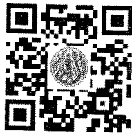
แบบฟอร์มส่งผลตรวจ ATK

ทั้งนี้ ผู้เข้ารับการประเมินฯ ทุกท่านให้มาถึงสถานที่เข้ารับการประเมินฯ (ห้องพักคอย ณ ห้องสมุดกระทรวงเกษตรและสหกรณ์ อาคาร ๓ ชั้น ๓) ก่อนเวลาประเมินฯ ไม่น้อยกว่า ๓๐ นาที และงดเว้นผู้ติดตามที่จะร่วมเดินทางเข้ามาในบริเวณสถานที่เข้ารับการประเมินฯ โดยไม่จำเป็น