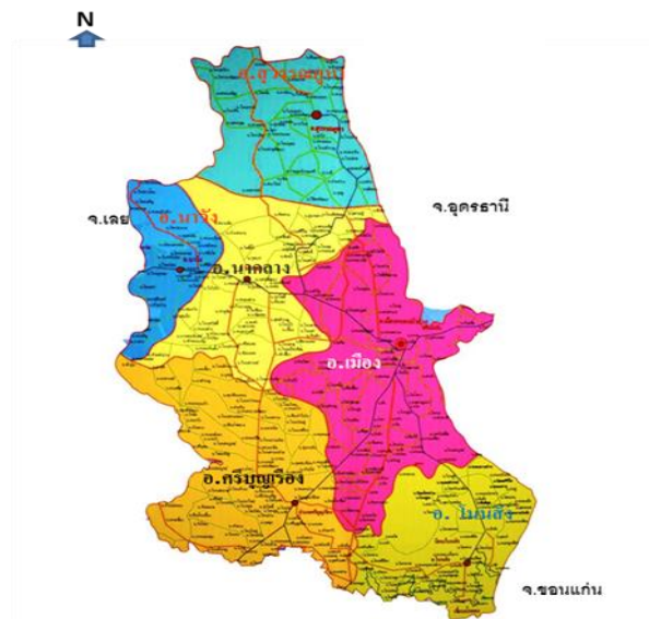
ภาพที่ ๑ อาณาเขตจังหวัดหนองบัวลำภู

๑) ที่ตั้ง ขนาดพื้นที่จังหวัดหนองบัวลำภู ตั้งอยู่ระหว่างเส้นรุ้งที่ ๑๗ องศาเหนือ และเส้นแวงที่ ๑๐๒ องศาตะวันออก อยู่ทางทิศตะวันออกเฉียงเหนือของประเทศไทย ห่างจากกรุงเทพมหานคร ตามทางหลวงแผ่นดินหมายเลข ๒๑๐ (กรุงเทพฯ - นครราชสีมา - ขอนแก่น - อุดรธานี - หนองบัวลำภู) เป็นระยะทางประมาณ ๖๐๘ กิโลเมตร โดยห่างจากจังหวัดอุดรธานี - หนองบัวลำภู ตามเส้นทางหลวงหมายเลข ๒๑๐ (อุดรธานี - เลย) ประมาณ ๔๖ กิโลเมตร หรือตามทางหลวงแผ่นดินหมายเลข ๒๒๘ (กรุงเทพฯ - สีคิ้ว - ชัยภูมิ - ชุมแพ - ศรีบุญเรือง - หนองบัวลำภู) ประมาณ ๕๑๘ กิโลเมตร มีขนาดพื้นที่ รวมทั้งจังหวัด ๓,๘๕๙.๑ ตารางกิโลเมตร หรือประมาณ ๒,๔๑๑,๙๓๗.๕ ไร่ คิดเป็นร้อยละ ๒.๒๗ ของภาคตะวันออกเฉียงเหนือ และร้อยละ ๐.๗๕ ของประเทศ (พื้นที่ประเทศ ๕๑๓,๐๒๙ ตารางกิโลเมตร หรือ ๓๒๐,๖๙๖,๘๙๘,๑๒๕ ไร่)