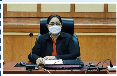
สำนักงานตรวจบัญชีสหกรณ์พิจิตร

วันที่ 2 กันยายน 2564 หัวหน้าส่วนราชการในสังกัดกระทรวงเกษตรและสหกรณ์จังหวัดพิจิตร และเจ้าหน้าที่ที่เกี่ยวข้อง ร่วมโครงการคลินิกเกษตรเคลื่อนที่ในพระราชานุเคราะห์สมเด็จพระบรมโอรสาธิราชฯ สยามมกุฎราชกุมาร ภายใต้นงานมีการให้บริการแจกเอกสาร แผ่นพับ และพันธุ์กล้าไม้แก่เกษตรกรที่มาร่วมงาน ณ สำนักงานเกษตรจังหวัดพิจิตร อำเภอเมืองพิจิตร จังหวัดพิจิตร