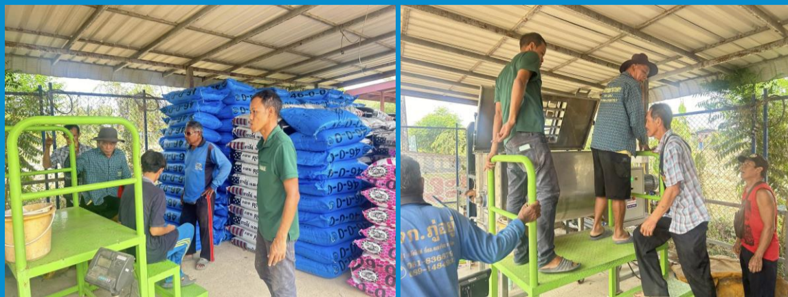
ซึ่งจะจำหน่ายให้กับสมาชิกกลุ่มฯและเกษตรกรในพื้นที่นำไปใช้ เพื่อช่วยลดต้นทุนการผลิต และเพิ่มประสิทธิภาพการผลิต

วันที่ 6 พฤษภาคม 2567 เจ้าหน้าที่สำนักงานเกษตรอำเภอองเจริญ ร่วมประชุมหารือกับคณะกรรมการศูนย์จัดการดินปุ๋ยชุมชนตำบลสำนักขุนเณร ณ หมู่ 7 ตำบลสำนักขุนเณร อำเภอองเจริญ จังหวัดพิจิตร ได้มีการประชุมวางแผนการผสมปุ๋ยตามค่าวิเคราะห์ดิน เช็กความพร้อมของอุปกรณ์ และเครื่องผสมปุ๋ย ทั้งนี้ทางกลุ่มฯ จะดำเนินการผสมปุ๋ยให้แก่สมาชิก ในวันที่ 7-8 พฤษภาคม 2567