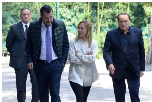
Matteo Salvini, Giorgia Meloni e Silvio Berlusconi

สำหรับการเลือกตั้งของอิตาลีที่ผ่านมา พบว่ามีความเป็นไปได้สูงที่นาง Giorgia Meloni หัวหน้าพรรค Brothers of Italy จะได้เป็นนายกรัฐมนตรีคนใหม่และคนแรกของอิตาลี นาง Giorgia Meloni ชูนโยบายที่เน้นการปกป้องผลประโยชน์ของประเทศ อาทิ การแก้ไขปัญหาเศรษฐกิจ วิกฤติพลังงานและต่อต้านผู้อพยพผิดกฎหมาย ขณะที่ด้านนโยบายต่างประเทศ ยังคงสนับสนุนนโยบายของสหภาพยุโรป เป็นพันธมิตรกับสหรัฐอเมริกา และสนับสนุนการให้ความช่วยเหลือแก่ยูเครนต่อไป อย่างไรก็ตาม วันนัดหมายวันที่ 13 ตุลาคม 2565 นาย