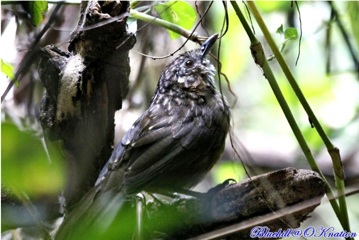
นกจู้เต๋นเขาหินปูน ชนิดย่อยพันธุสระบุรี