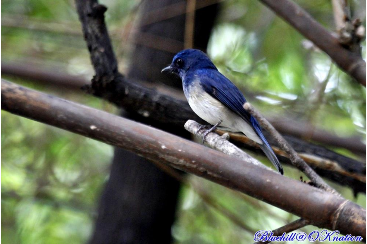
นกจับแมลงอกสีฟ้า (Hainan Blue Flycatcher)