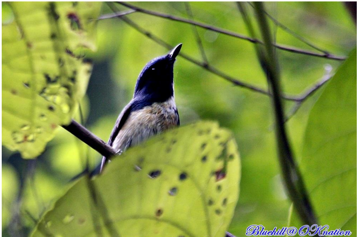
นกจับแมลงอกส้มท้องขาว (Tickell's Blue Flycatcher)

แม้พบตัวนกจู้เต้นเขาหินปูนชนิดย่อย calcicola ได้ไม่ยากนัก ด้วยว่านกหากินอยู่บริเวณพื้นที่แคบ ๆ ของวัดถ้ำบ่อปลา แต่ประชากรก็มีจำนวนน้อยลงทุกปี เนื่องจากเขาหินปูนซึ่งเป็นบ้านพักพิง ถูกทำลายลงไปมาก