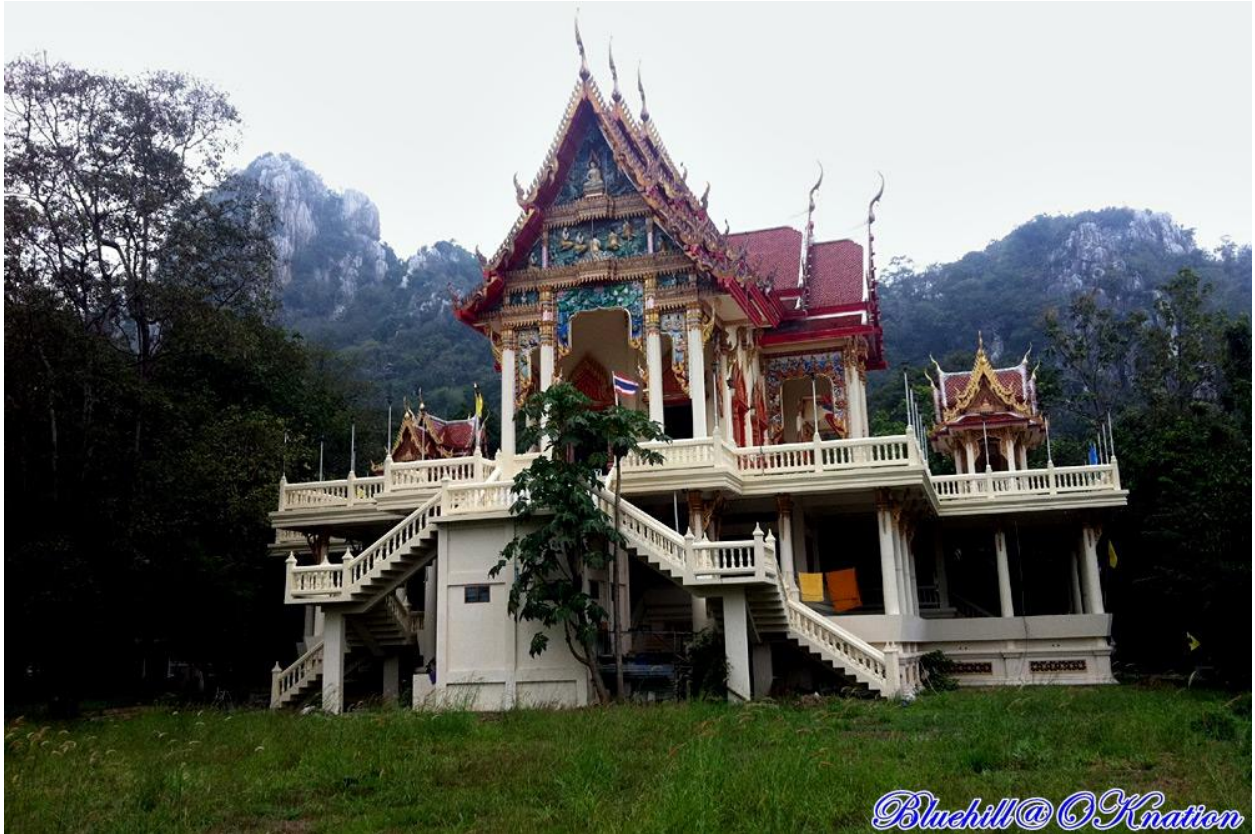
เทือกเขาหินปูน ทอดตัวอยู่ด้านหลังวัดเขาพระพุทธบาทน้อย