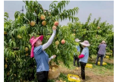
ตำบลหยางชาน เมืองอู่ซี มณฑลเจียงซู