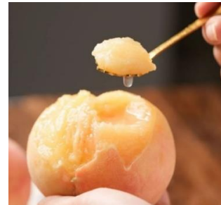
ลูกพีชที่ออกผลช่วงปลายฤดูกาล

ช่วงเวลาฤดูกาลของลูกพีชฉุ่มมีเเกจากตำบลหยางชานค่อนข้างสั้น ใน ๑ ปีจะมีโอกาสได้รับประทานลูกพีชช่วงที่อร่อยที่สุดเพียงแค่เดือนเดียวเท่านั้น นอกจากนี้ยังมีผลผลิตต่อปีไม่มากมาก ซึ่งสวนทางกับความต้องการของตลาดที่ค่อนข้างสูง โดยเมื่อปี ๒๕๖๕ ตำบลหยางชานมีผลผลิตลูกพีชฉุ่มมีเเกอยู่ที่ ๓๔,๐๐๐ ตัน มีมูลค่าประมาณ ๘๕๐ ล้านบาท ลูกพีชฉุ่มมีเเกจากหยางชานได้เข้าครองตลาดลูกพีชสดในเชียงใหม่ และเป็นที่ชื่นชอบของผู้บริโภคทั้งในประเทศจีนและต่างประเทศ