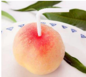
ลูกพีชที่ออกผลช่วงปลายฤดูกาล

ลูกพีชฉุ่มมีเเกจากตำบลหยางชานจะเริ่มออกผลช่วงเดือนพฤษภาคมถึงกันยายน ลูกพีชที่ออกผลในแต่ละช่วงเวลาจะมีความพิเศษที่ต่างกันไป ลูกพีชฉุ่มมีเเกที่ออกผลตอนต้นฤดูกาลจะมีเนื้อหวานกรอบ ลูกพีชที่ออกผลในช่วงกลางฤดูกาลจะมีเนื้อนุ่มและหวานมากกว่าลูกพีชที่ออกผลตอนต้นฤดูกาล ส่วนลูกพีชที่ออกผลช่วงปลายฤดูกาลจะมีเนื้อนิ่มและหวานมากที่สุด สามารถใช้หลอดจิ้มลงในเนื้อแล้วดูดน้ำหวานดื่มจากผลโดยตรงได้เลย