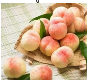
ลูกพีชฉู่มีเถาจากตำบลหยางชาน

honey peach หรือ ลูกพีชฉู่มีเถาจากตำบลหยางชาน เมืองอู่ซี มณฑลเจียงซูมีชื่อเสียงโด่งดังในประเทศจีนจนถูกเรียกว่าเป็น “บ้านเกิดของลูกพีชฉู่มีเถา” เนื่องจากลูกพีชฉู่มีเถาของที่นี่ ผลใหญ่กลม อวบอิม เปลือกบางลอกง่าย เนื้อนุ่มและฉ่ำไปด้วยน้ำหวานเข้มข้น มีกลิ่นหอมสดชื่น ทานที่ที่หีบลูกพีชขึ้นมากก็จะได้กลิ่นหอมสดชื่นโชยเข้าจมูก เมื่อกัดเนื้อพีชนุ่มๆ น้ำหวานเข้มข้นจากเนื้อลูกพีชจะไหลล้นออกจากฝามือลงมาถึงข้อศอกภายในปากพุ่งไปด้วยกลิ่นหอมและรสหวานจากลูกพีชฉู่มีเถา ลักษณะภายนอกของลูกพีชฉู่มีเถาแท้จากหยางชาน ด้านบนผลลูกพีชจะต้องมีสีแดงแกมชมพูระเรื่อ ด้านล่างผลและเนื้อลูกพีชมีสีเหลืองครีม