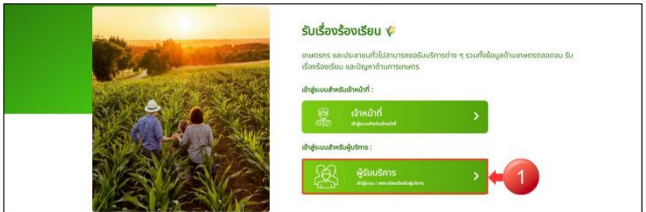
ภาพที่ 1 หน้าหลักสำหรับลงชื่อเข้าใช้งานระบบ

ระบบจะแสดงหน้าเข้าสู่ระบบสำหรับผู้รับบริการ