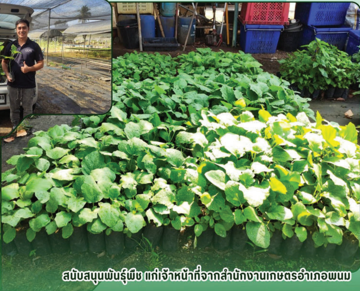
สนับสนุนพันธุ์พืช แก่เจ้าหน้าที่จากสำนักงานเกษตรอำเภอพนม