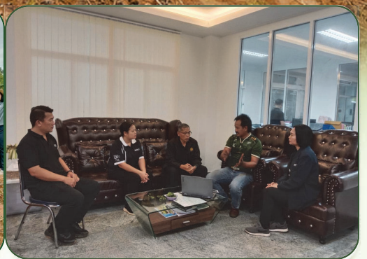
หารือร่วมกับเจ้าหน้าที่เทศบาลตำบลคลองชะอุ่นในการเตรียมพันธุ์ไม้เพื่อลงปลูก