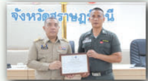
ผู้ว่าราชการจังหวัดสุราษฎร์ธานี มอบประกาศนียบัตร