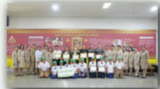
ภาพหมู่ผู้ได้รับรางวัลดีเด่น ระดับจังหวัด ประจำปี 2569