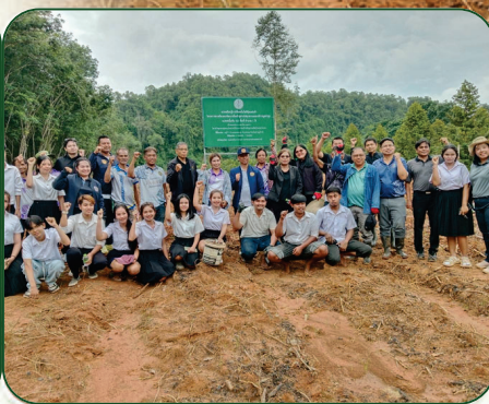
คณะผู้บริหารและเจ้าหน้าที่ร่วมถ่ายภาพเป็นที่ระลึก ณ แปลงเรียนรู้