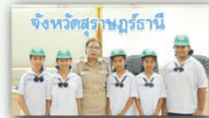
เกษตรจังหวัดสุราษฎร์ธานี ร่วมถ่ายภาพกับสมาชิกยุวเกษตรกร