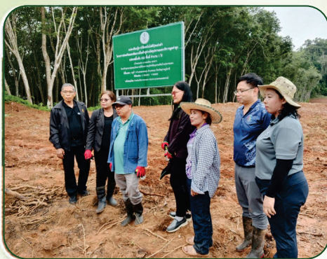
ร่วมปลูกขมิ้นในแปลงเรียนรู้ของนางระเบียบ แดงขาว