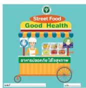
ป้าย Street Food Good Health

หมายเหตุ หากป้ายรับรองยังไม่หมดอายุการรับรอง สามารถใช้ได้จนสิ้นอายุการรับรอง หลังจากนั้นให้ผู้ประกอบการดำเนินการตามมาตรฐานสุขาภิบาลอาหาร ภายใต้วิถีชีวิตปกติใหม่ (SAN&SAN Plus)