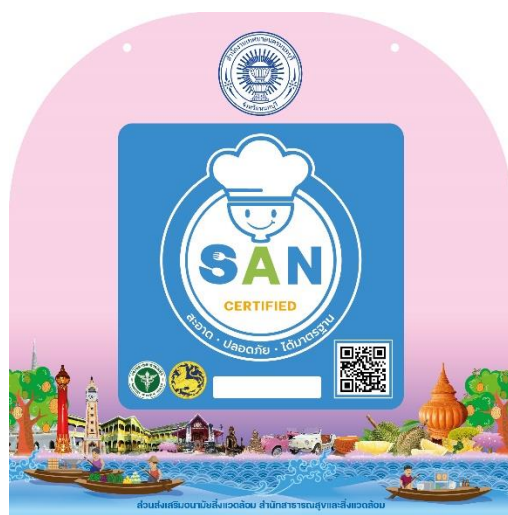
ตัวอย่าง การจัดทำป้ายร่วมกับตราสัญลักษณ์ขององค์กร