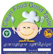
ป้าย Clean Food Good Taste

ตั้งแต่ปีงบประมาณ 2567 เป็นต้นไป ให้ยกเลิกการใช้ป้ายรับรองมาตรฐานสุขาภิบาลอาหาร ดังต่อไปนี้