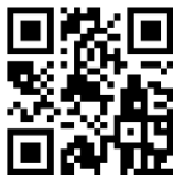
รายงานการประชุม SC จังหวัดยะลา ครั้งที่ ๑/๒๕๖๖

มติที่ประชุม รับทราบรายงานความก้าวหน้าผลการดำเนินงานโครงการตามแผนฯ พร้อมทั้งเร่งรัดหน่วยงานให้เบิกจ่ายเงินงบประมาณให้เป็นไปตามมาตรการใช้จ่ายงบประมาณรายจ่ายประจำปี งบประมาณ พ.ศ. ๒๕๖๖ ที่กำหนด และขอความร่วมมือหน่วยงานปรับปรุงแผน/ผล ให้สอดคล้องกับ งบประมาณที่ได้รับจัดสรร/ดำเนินการให้เป็นปัจจุบัน