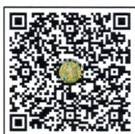
แบบฟอร์มรายงานผลฯ