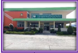
บทบาทหน้าที่

E-mail : Saraban Website: www.raot.co.th