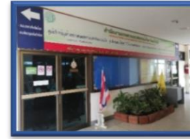
บทบาทหน้าที่

Website: https://www.opsmoac.go.th/yasothon